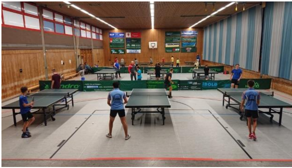
Jugendtraining in der Birkmannsweiler-Halle